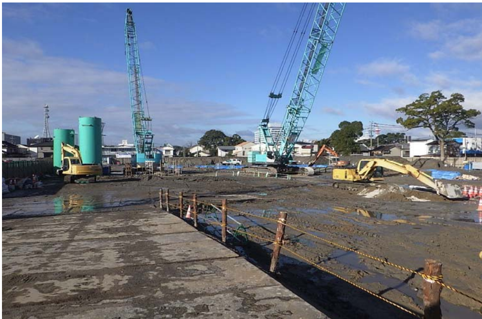
撮影内容 6 全景写真 12月28日現在