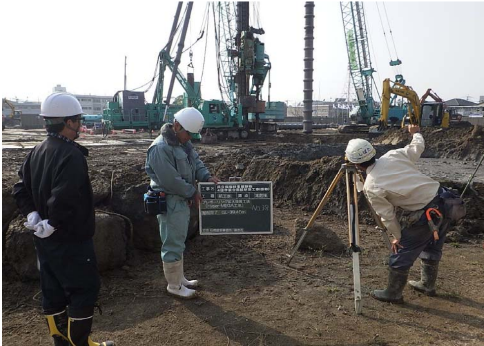
撮影内容 1 本杭施工状況 12月9日撮影