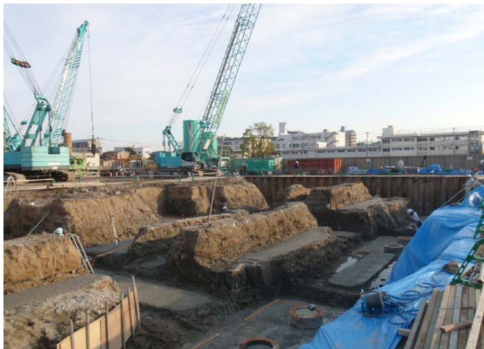
撮影内容 2 捨てコンクリート打設完了 12月24日撮影