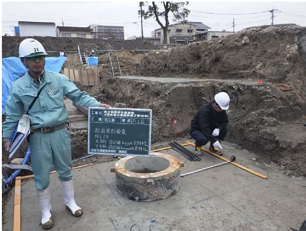
撮影内容 3 杭偏芯確認状況 12月26日撮影