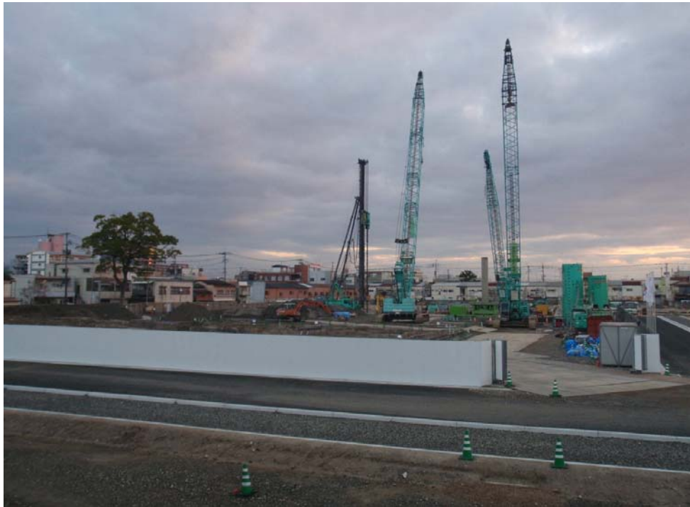
撮影内容 5 全景写真 12月28日現在