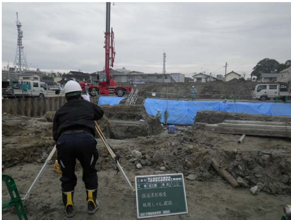
撮影内容 4 杭頭レベル確認状況 12月26日撮影