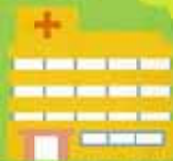
医療法人 静便堂 白石共立病院