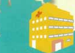
医療法人 松籟会 河畔病院