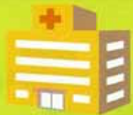
佐賀社会保険病院