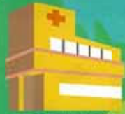
医療法人 光仁会 西田病院